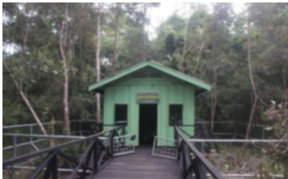
Stasiun Ekominawisata Balitbang Bengkulu