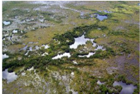
Kawasan gambut dengan tasik-tasik