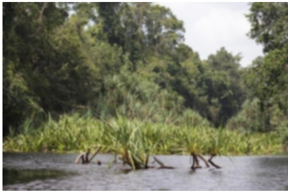
Sungai dengan air hitam