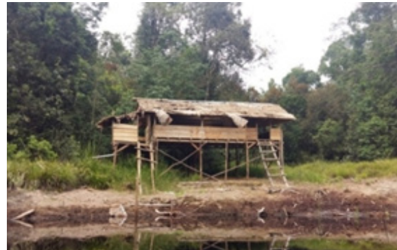
Pondok Penelitian Jepang