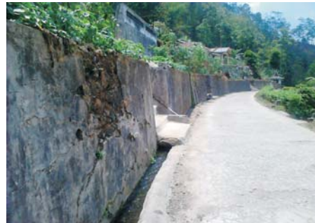
Gambar (Figure) 3