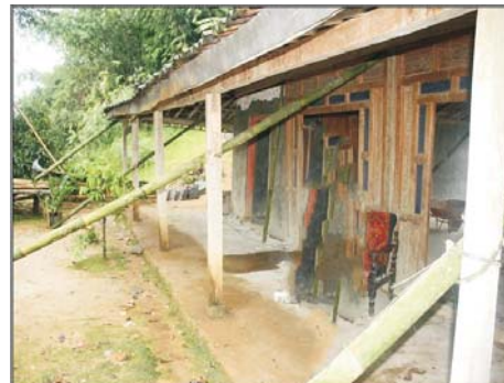
Gambar (Figure) 4

Gambar 1. Pembangunan jalan dengan konstruksi beton