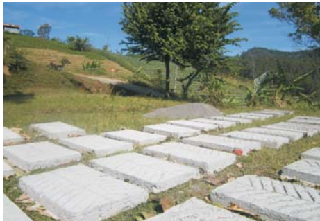
Gambar (Figure) 1

dilaksanakan dengan maksud agar diberikan hasil panen yang melimpah dan terhindar dari bencana. Beberapa contoh dokumentasi strategi coping yang dilakukan masyarakat Tawangmangu dapat dilihat pada Gambar 1, 2, 3, dan Gambar 4.