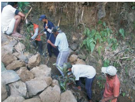
Gambar (Figure) 2