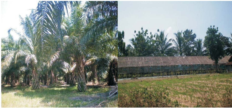
Gambar 2. Kebun kelapa sawit dan peternakan Desa Seri Pendowo Lampung Selatan. Figure 2. Palm oil plantation and livestock in Seri Pendowo Village South Lampung.