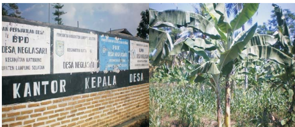
Gambar 3. Kebun masyarakat dan Kantor Balai Desa Neglasari Lampung Selatan. Figure 3. Community plantation and Neglasari Village office South Lampung.